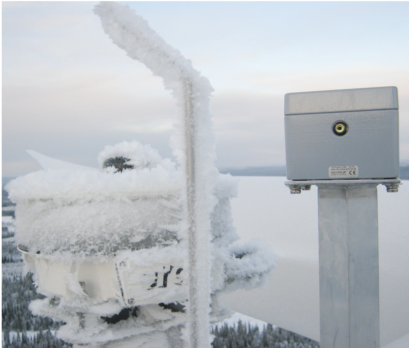
Lichtsensoren-Einheit (beheizt) auf dem Maschinenhaus