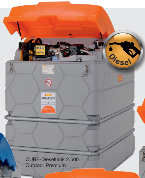
CUBE-Dieseltank 2.500l Outdoor Premium

2 x CUBE-Tank für AdBlue® 2.500l Outdoor Premium (10306), Erweiterungseinheit 2.500l Outdoor (10307)