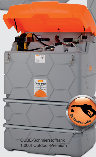
CUBE-Schmierstofftank 1.000l Outdoor-Premium