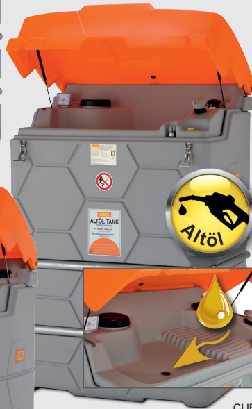
CUBE-Altöltank 1.000l Outdoor

2 x CUBE-Dieseltank 2.500l Outdoor Premium (10299), Erweiterungseinheit 2.500l Outdoor (10300), Förderleistung 72 l/min