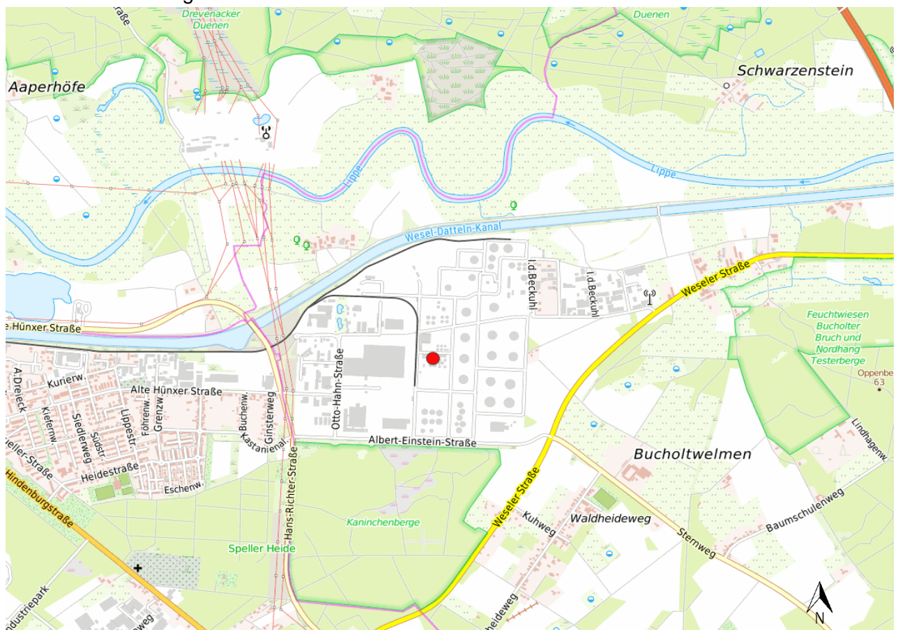
Abbildung 1 Angrenzende Umgebung (Auszug aus der topographischen Karte „Quelle Geoportal-NRW“; Standort rot markiert – ohne Maßstab

Ein Ausschnitt aus der topographischen Karte mit Darstellung der Vorhabensfläche kann der nachstehenden Abbildung entnommen werden.